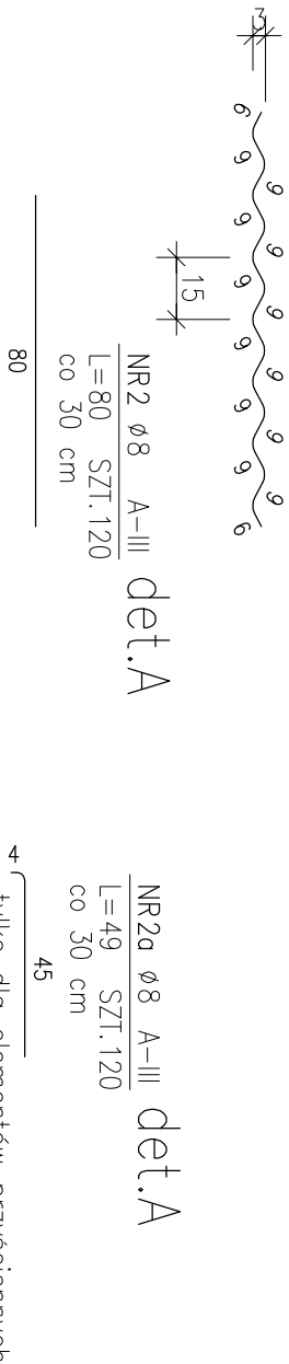
NR2a ø8 A-III L=49 SZT.120 co 30 cm det.A tylko dla elementów przysięciennych