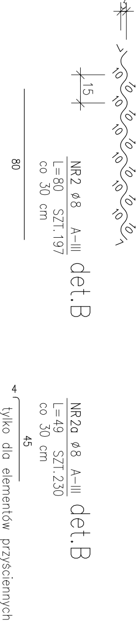
NR2a ø8 A-III L=49 SZT.230 co 30 cm det.B tylko dla elementów przysięciennych